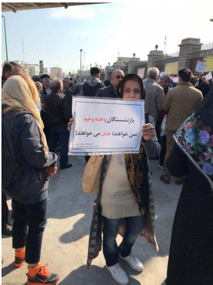
بقیه در صفحه ۱۵

*روز یکشنبه ۵ اسفند، بازنشستگان صندوقهای مختلف