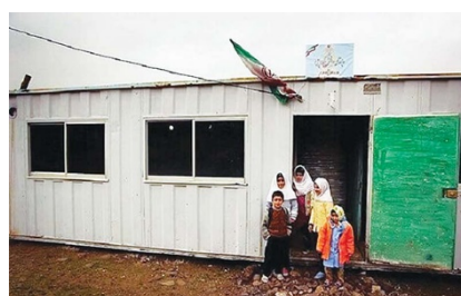
کانکسی تحصیل می کنند

مدیرکل تعمیر، تجهیز و نوسازی مدارس استان مرکزی گفت: "در حال حاضر در استان مرکزی ۶۴۲ دانش آموز در ۵۸ مدرسه کانکسی با ۷۲ کلاس تحصیل می کنند که ۶ فضای جایگزین در این حوزه در دستور قرار گرفته است."