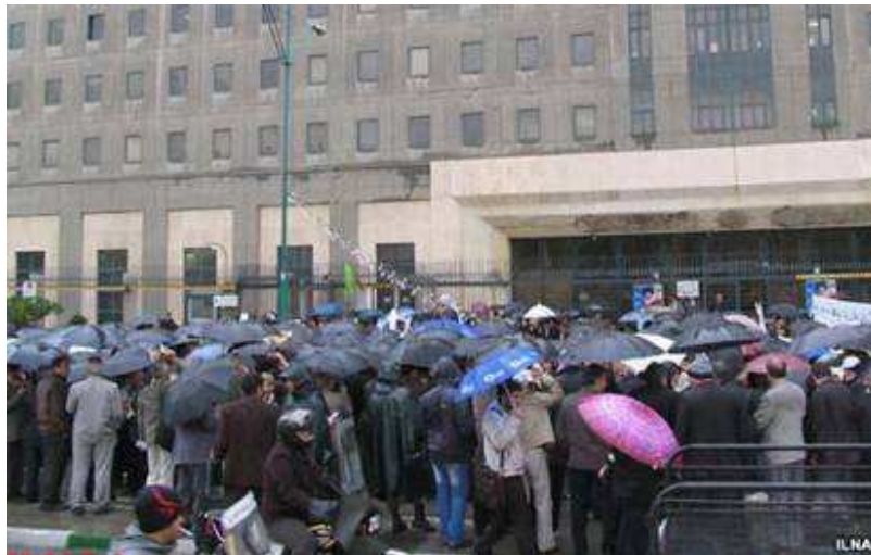
عکس: تحصن کارگران علیه قانون کار