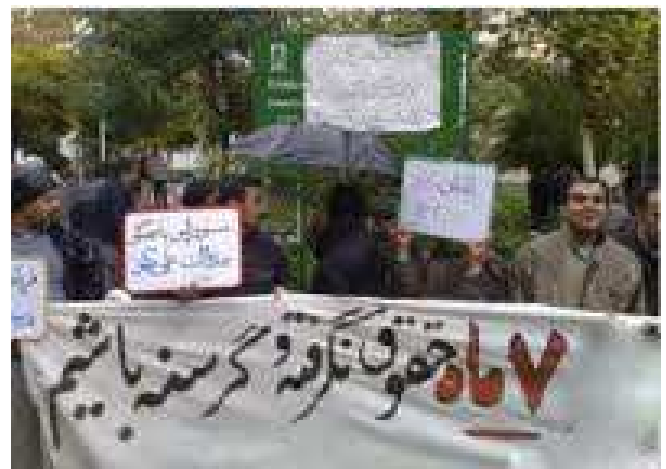
بسته منتظر ماندند.

* به گزارش آژانس ایران خبر، کارگران پیمانی شرکت گاز همدان در روز سه