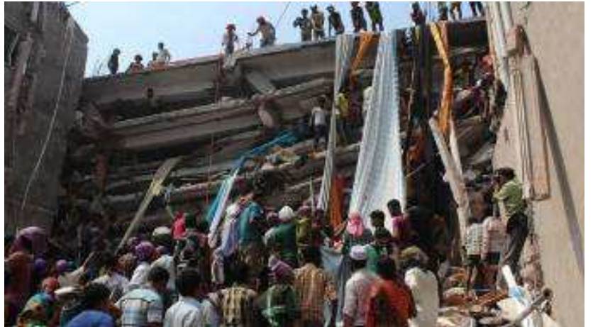
فاجعه مرگبار بنگلادش

اکثر کارگران این صنعت در بنگلادش زنان جوانی هستند که با دستمزدهای بسیار ناچیز به بردگی گرفته شده و قربانی طمع سرمایه داران می شوند. بی دلیل نیست که پاپ فرانسیس، رهبر معنوی مسیحیان کاتولیک، وضعیت این کارگران را "بردگی" توصیف کرد. با این حال نه تنها صدای کارگران، بلکه اعتراضات فعالان کارگری و سازمانهای