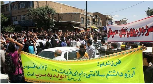
این شهرستان تجمع و نسبت به این تصمیم مخابرات اعتراض داشتند. قضایی در خصوص مطالباتشان صادر شود.

کارگران پیمانکار اجرایی که برای شرکت محوسازان مشغول کار در پارس جنوبی هستند در روز سه شنبه ۲۹ مرداد، پس از ۷ روز به اعتصاب خود پایان دادند. به گزارش کانون مدافعان حقوق کارگر، پس از ۷ روز اعتصاب و تحمیل زیان ناشی از تاخیر در پیشرفت کار پروژه، پای کارفرما به معرکه باز و شرکت محوسازان مجبور به پرداخت سه ماه حقوق کارگران پیمانکار اجرایی شد. این موفقیت کارگران پیمانکار اجرایی باعث شد که کارکنان بلاواسطه شرکت محوسازان هم دست از کار بکشند و طولی نکشید که آنان نیز حقوق معوقه خود را دریافت کردند.