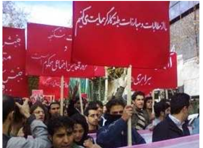
۱۷ ژوئیه ۱۹۹۹

شورش دانشجویان، این حساس ترین درجه سنج تنشهای موجود در دل جامعه، هشدار از انفجارات پیش رو است. این اولین گلوله های انقلاب ایران است که شلیک می شود. (اولین گلوله های انقلاب ایران - آلن وودز،