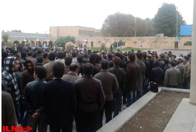
Iranian Labour News Agency

*تجمع کارگران شرکت قطعات بتونی گیلان در محوطه این کارخانه روز شنبه ۱۸ آبان وارد پنجمین روز شد. به گزارش ایلنا، کارگران اعلام کردند که حقوق کارگران هنوز پرداخت نشده و مسئولان استانی همچنان در برابر مطالبات صنفی ۲۰۰ کارگر سکوت کرده اند. و در جمع کارگران حاضر نشده تا صدای آنها را بشنوند. حرکت اعتراضی این کارگران در روز دوشنبه ۱۳ آبان آغاز شد.