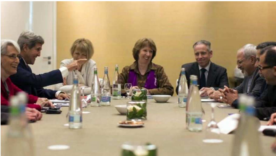
شیپور دروغ بدمند.

برسد، سرنوشت ولایت اش نه در ژنو که در خاک ایران ویران شده و به دست زنان و مردان آزادیخواه رقم خواهد خورد. وقاحت شیادانه مقام معظم در انتخاب هریک از این دو راه، فقط به افزایش خشم و نفرت مردم از نظام ولایت فقیه منجر خواهد شد.