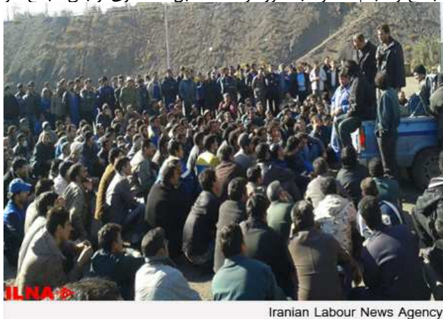
Iranian Labour News Agency

به گزارش ایلنا، کارگران فصلی مجتمع کشت و صنعت هفت تپه طی روزهای ۱۷ و ۱۸ آذر در اعتراض به محقق نشدن وعده‌های کارفرما دست از کار کشیده بودند، روز سه شنبه پس از حضور مسئولان اداره تعاون، کار و رفاه اجتماعی شهرستان شوش در این مجتمع و انجام مذاکره، به طور موقت