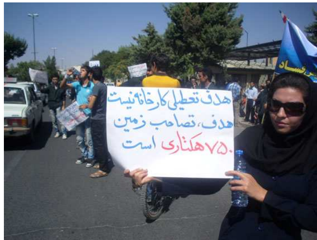
معرض خطر می‌بینند.

۱۵۰۰ کارگر پلی‌اکریل اصفهان سالهاست در قالب شش شرکت زیر مجموعه تحت مسئولیت شرکت مادر (هلدینگ) کار می‌کنند و حال با تصمیم کارفرما مبنی بر جدا سازی شرکت‌های زیر مجموعه، امنیت شغلی شان را در