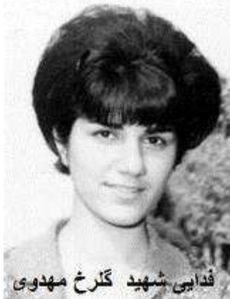
فدایی شهید گلرخ مهدوی