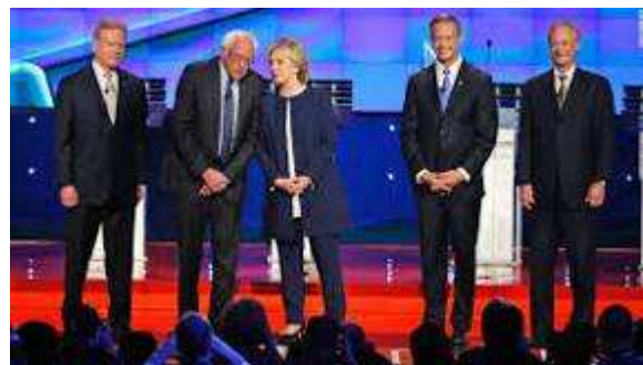
دو نوع برخورد با ساندرز

وی برای پرداخت کمک مالی به کمپین خود شرایطی را اعلام کرده است که شامل کمک از منبع مالی خود شخص و نه غیر، کمک از کارت اعتباری شخصی و نه از کارت یک کمپانی یا شخص و نیز پیمانکار دولت نبودن کمک کننده می شود.