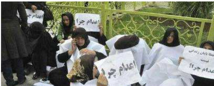
عکس: تجمع اعتراضی خانواده های حکومین به اعدام