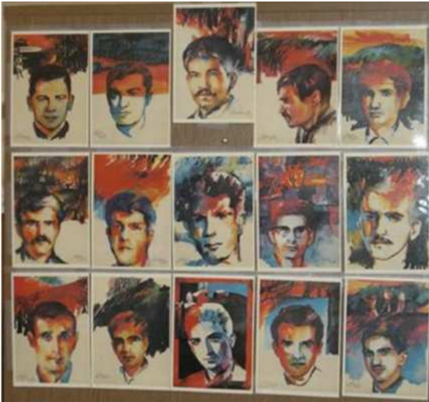
شهدای حماسه سیاهکل

جنبش پیشتاز فدایی کمر به ستاندن آزادی و عدالت بستند، می دانستند که گام در راهی سخت و طولانی گذاشته اند. اما آنان این راه را با پیکارهای خونین و با قبول هزینه های آن کوتاه کردند.