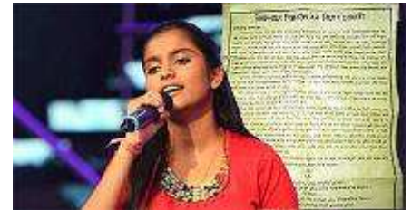
سیاسی برخوردار است.

چین در سال ۱۹۹۷ حاکمیت خود بر هنگ کنگ را باز پس گرفت. این منطقه بر اساس اصل "یک کشور دو نظام"، باوجود قرار داشتن در حاکمیت چین، به صورت فرمال از خودمختاری قانونی، اقتصادی و