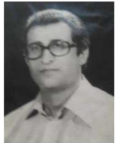
فدایی شهید رفیق حسن توکل