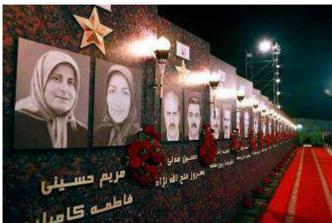
حاکم بر ایران را برای پایان دادن به

در چهارمین سالگرد قتل عام ۵۲ تن از مجاهدان مستقر در شهر اشرف (در عراق) که به دستور رژیم ایران توسط دولت دست نشانده و مزدورانش در عراق صورت گرفت، خانم مریم رجوی، رئیس جمهور برگزیده مقاومت ایران ضمن گرامیداشت خاطره این شهیدان گفت: اعدام جمعی مجاهدین نیمه پنهان خوردن زهر اتمی و پروژه برجام است. رژیم ایران پیش از شروع مذاکرات علنی با کشورهای ۵+۱ و امضای تفاهم نامه در آذر ماه ۹۲ دست به قتل عام اشرف زد و به دنبال تایید برجام توسط خامنه ای در مهر ۹۴ لیبرتی را با موشک درهم کوبید. تمام مراحل برجام از مذاکرات مخفی تا تصویب نهایی، با حمله و کشتار علیه اشرفیها همراه بوده است. این رژیم برای ادامه حیات خود نیاز دارد که