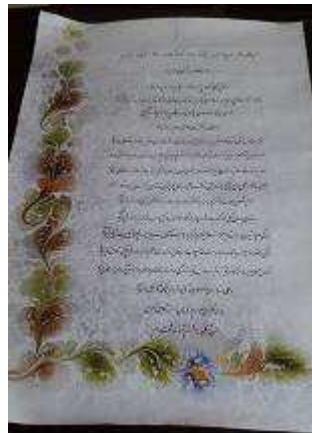
خوشنویس شده متن وصیتنامه