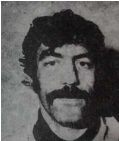
فدایی شهید رفیق