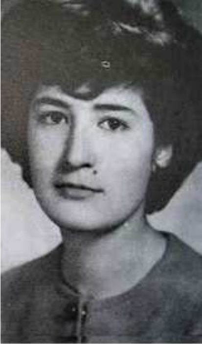
فدایی شهید رفیق